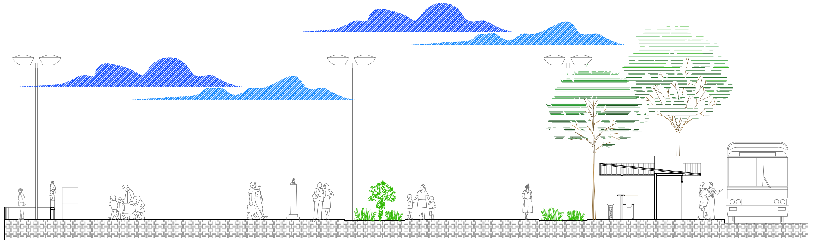
Situação Proposta - Via elevada ESC/ 1:125